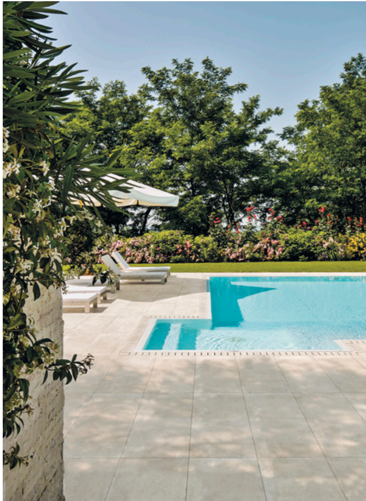
R7KJ ベージュ 598x1198