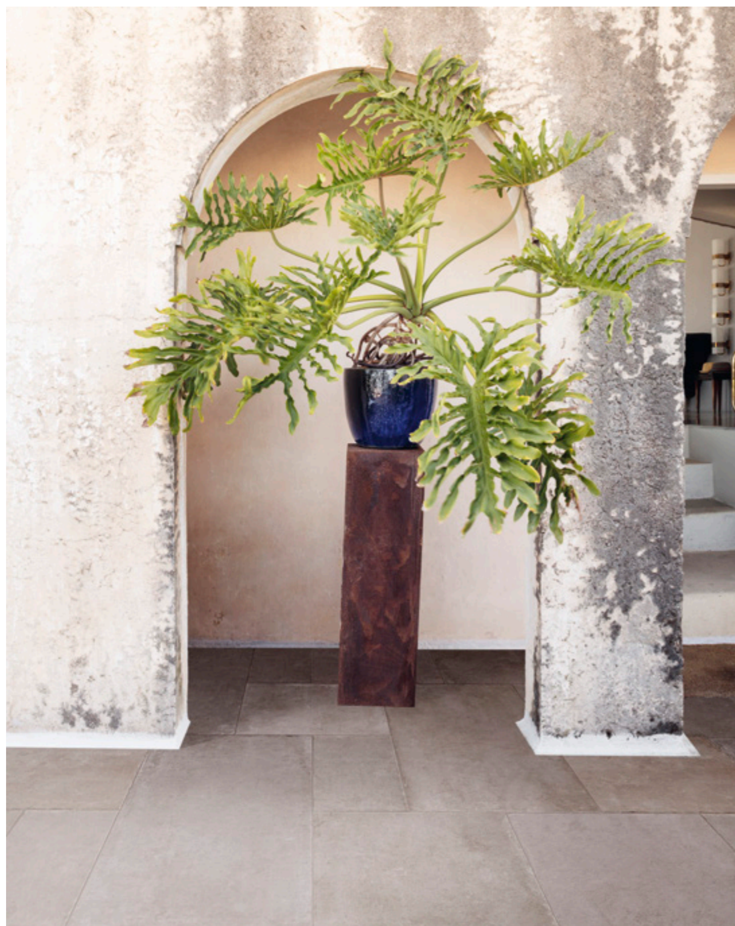
R8DS マルチカラー 598x1198