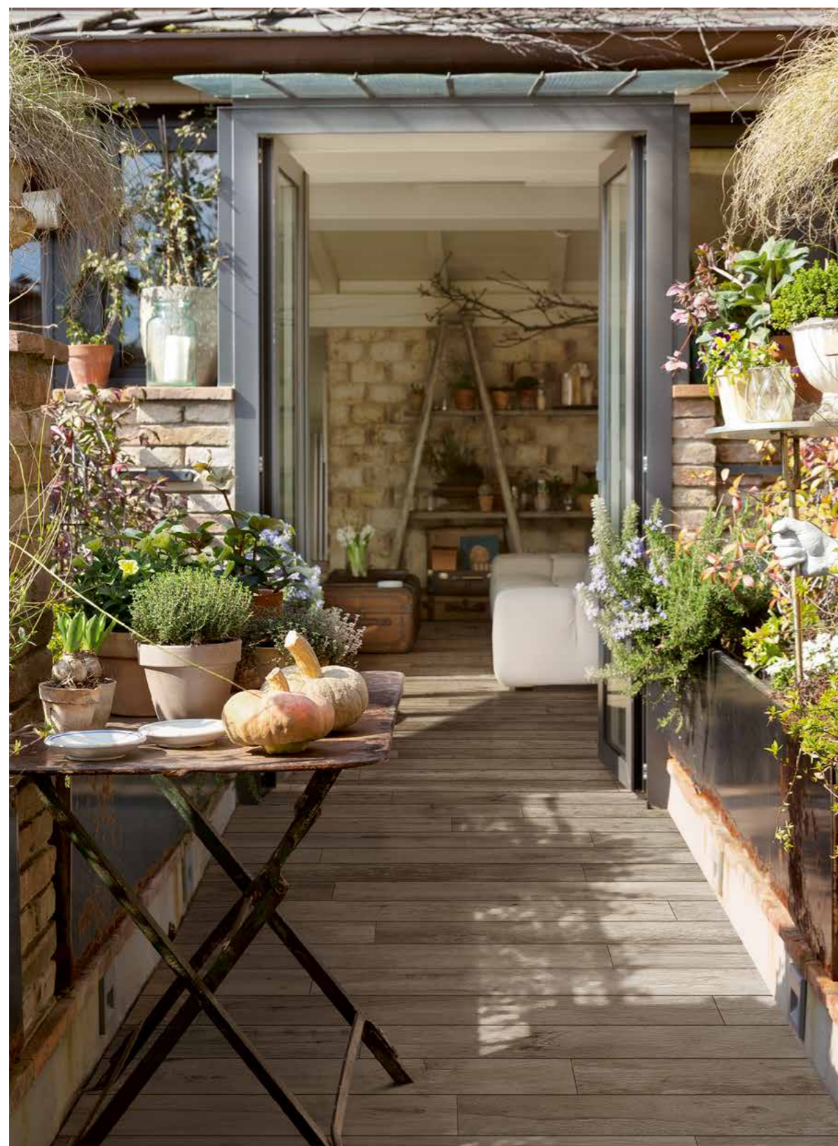
R56Q アッシュストラクチャー 200X1200