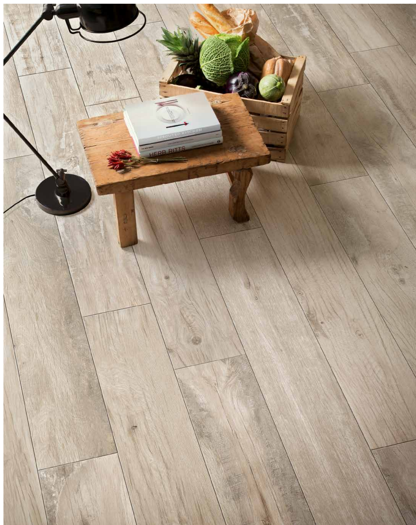
R55Z アイボリー 200X1200