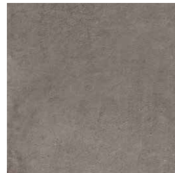
R7KK 598X1198 ¥19,000/㎡