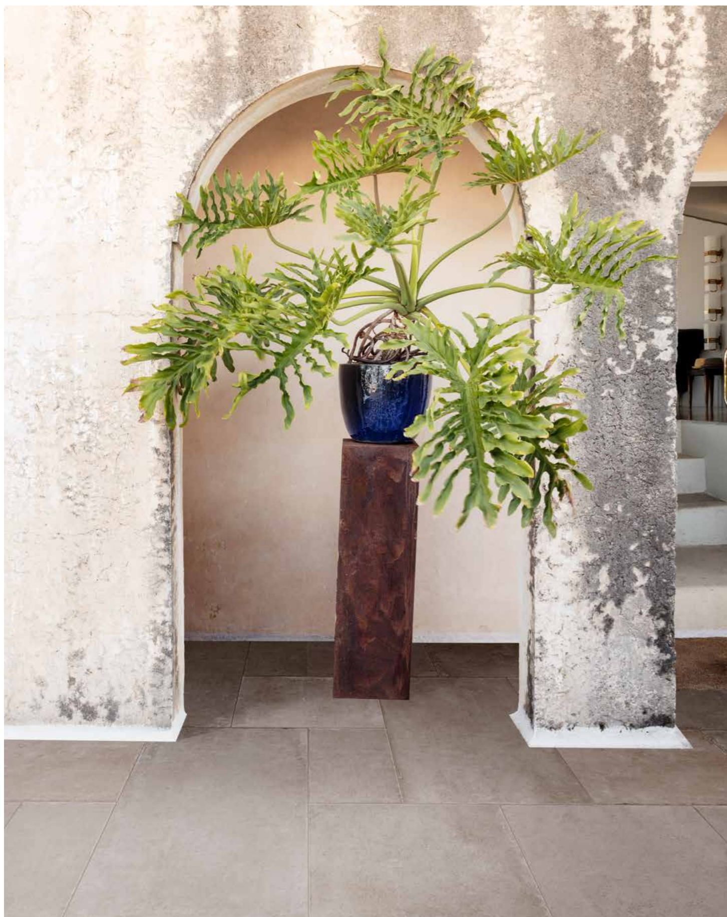
R8DS マルチカラー マット 598X1198 - (598X1198/1枚,598X598/1枚,298X598/1枚)のセット)