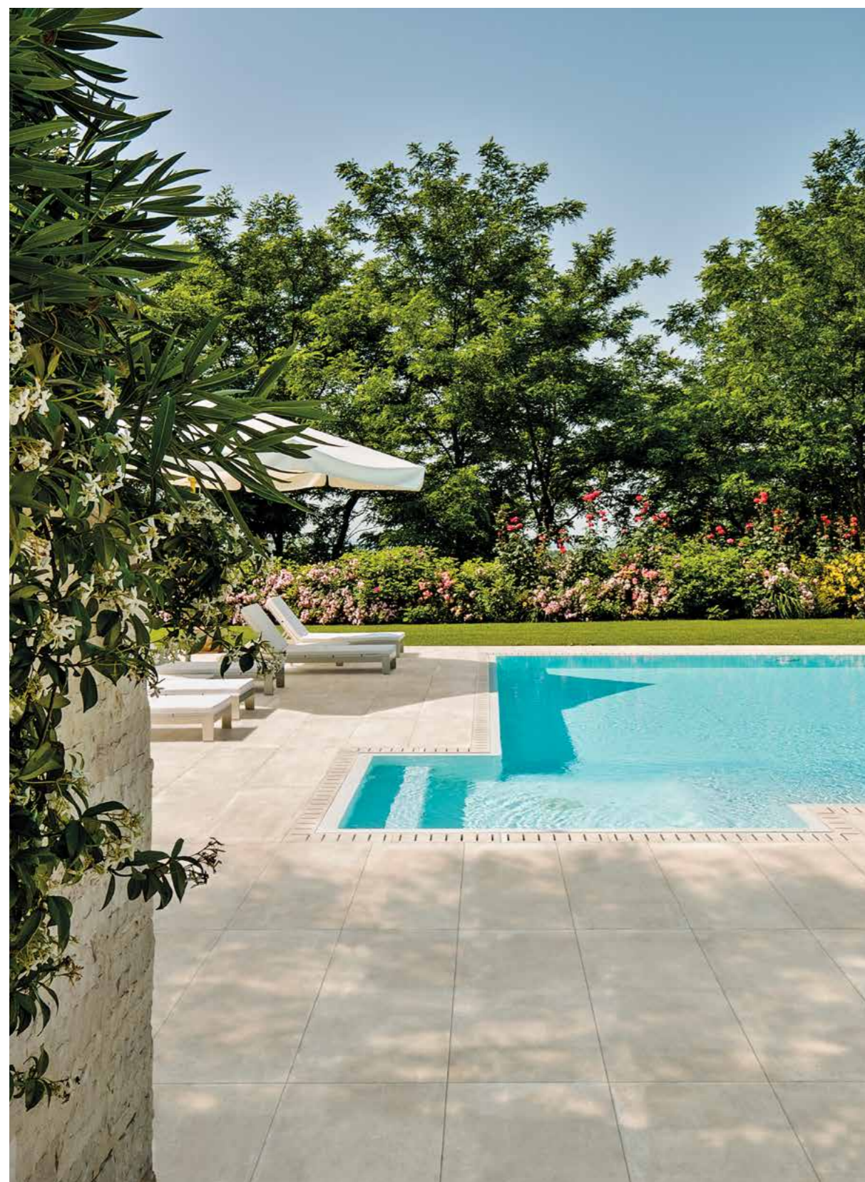
R7KJ ベージュ マット 598X1198