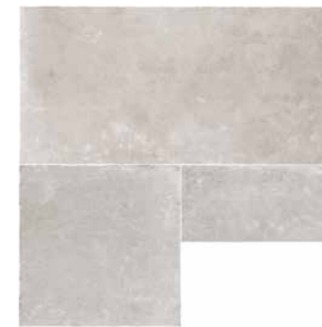
R7KU 600X2100 タンブルエッジ ¥19,000/㎡ R8DP 600X2100 ¥19,000/㎡ (598X1198/1枚,598X598/1枚,298X598/1枚)のセット)