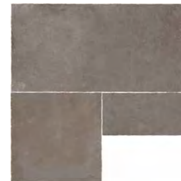
R7KR 600X2100 タンブルエッジ ¥19,000/㎡ R8DS 600X2100 ¥19,000/㎡ (598X1198/1枚,598X598/1枚,298X598/1枚)のセット)