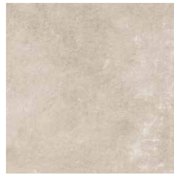
R7KJ 598X1198 ¥19,000/㎡