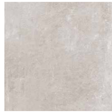
R7KG 598X1198 ¥19,000/㎡