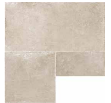
R7KV 600X2100 タンブルエッジ ¥19,000/㎡ R8DR 600X2100 ¥19,000/㎡ (598X1198/1枚,598X598/1枚,298X598/1枚)のセット)