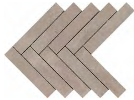
R02F 449X616 モザイク カラーチェ* ¥ 30,000 /㎡