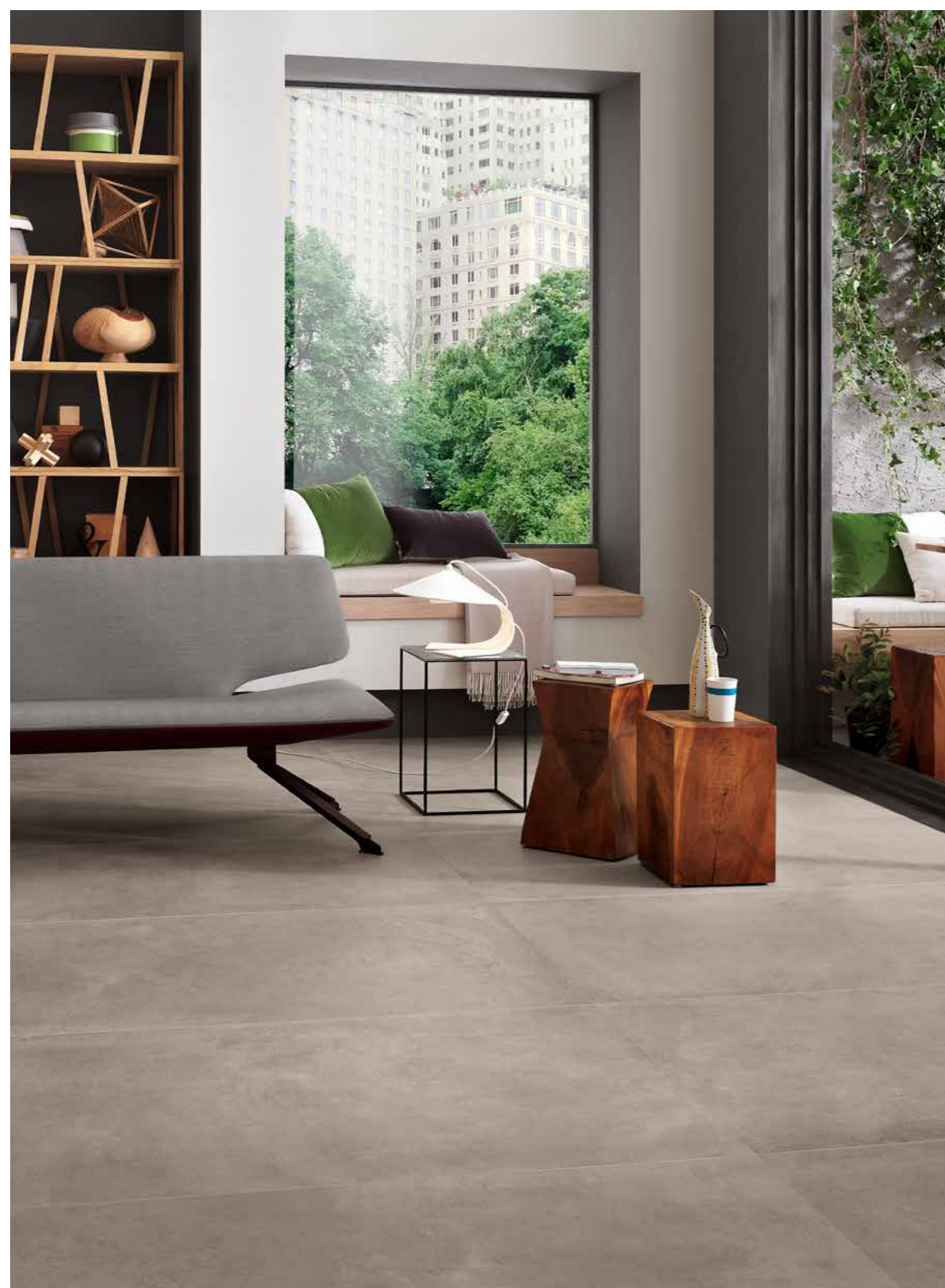
R00D アッチャイオ マット 746x1494 -