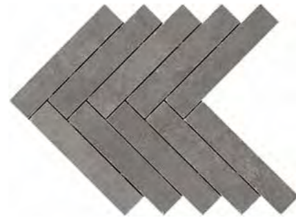
R02H 449X616 モザイク ピオンボ* ¥ 30,000 /㎡

*モザイク 449X616 アンティーク調の縁加工(タンブル仕上げ)を施したモザイクタイル