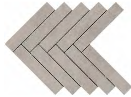
R02G 449X616 モザイク アッチャイオ* ¥ 30,000 /㎡