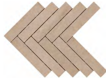
R02E 449X616 モザイク サッピア* ¥ 30,000 /㎡